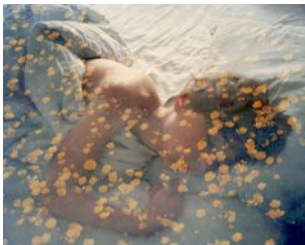
Erle M. Kyllingmark YDASSA #47, 2020 Analog C-Print Image size: 54,7 x 67 cm Framed size: 56,7 x 69 cm Edition of 5 plus 2 artist's proofs (#1/5) (EKY-038)