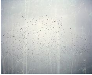
Erle M. Kyllingmark YDASSA #07, 2020 Analog C-Print Image size: 94 x 117,5 cm Framed size: 97 x 120 cm Edition of 5 plus 2 artist's proofs (#1/5) (EKY-035)