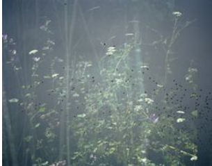
Erle M. Kyllingmark YDASSA #02, 2020 Analog C-Print Image size: 54,7 x 68 cm Framed size: 56,7 x 70 cm Edition of 5 plus 2 artist's proofs (#1/5) (EKY-036)