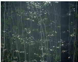
Erle M. Kyllingmark YDASSA #46, 2020 Analog C-Print Image size: 94 x 117,5 cm Framed size: 97 x 120,5 cm Edition of 5 plus 2 artist's proofs (#1/5) (EKY-039)