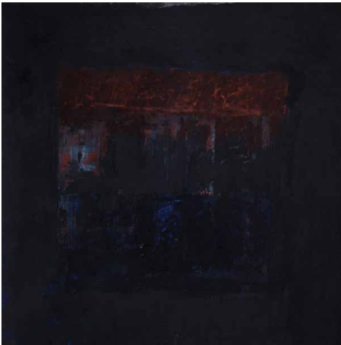
Saâd Hassani, Sans titre , 2022, Technique mixte sur toile, 180 x 180 cm