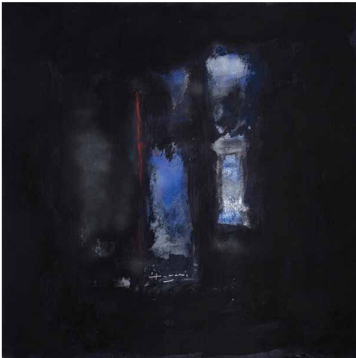
Saâd Hassani, Échiquier , 2022, Technique mixte sur toile, 110 x 110 cm