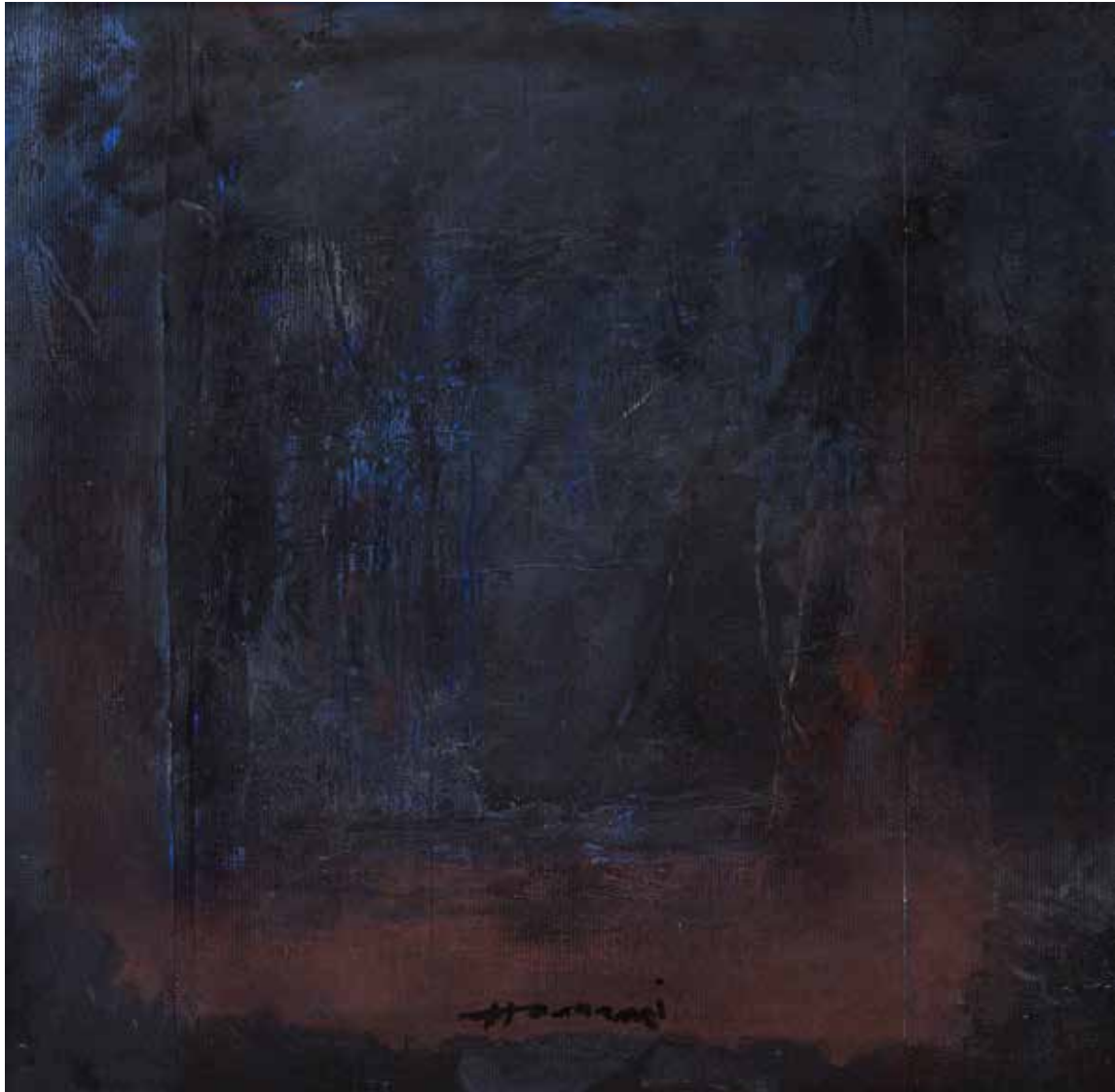
Saâd Hassani, Sans titre , 2022, Technique mixte sur toile, 50 x 50 cm