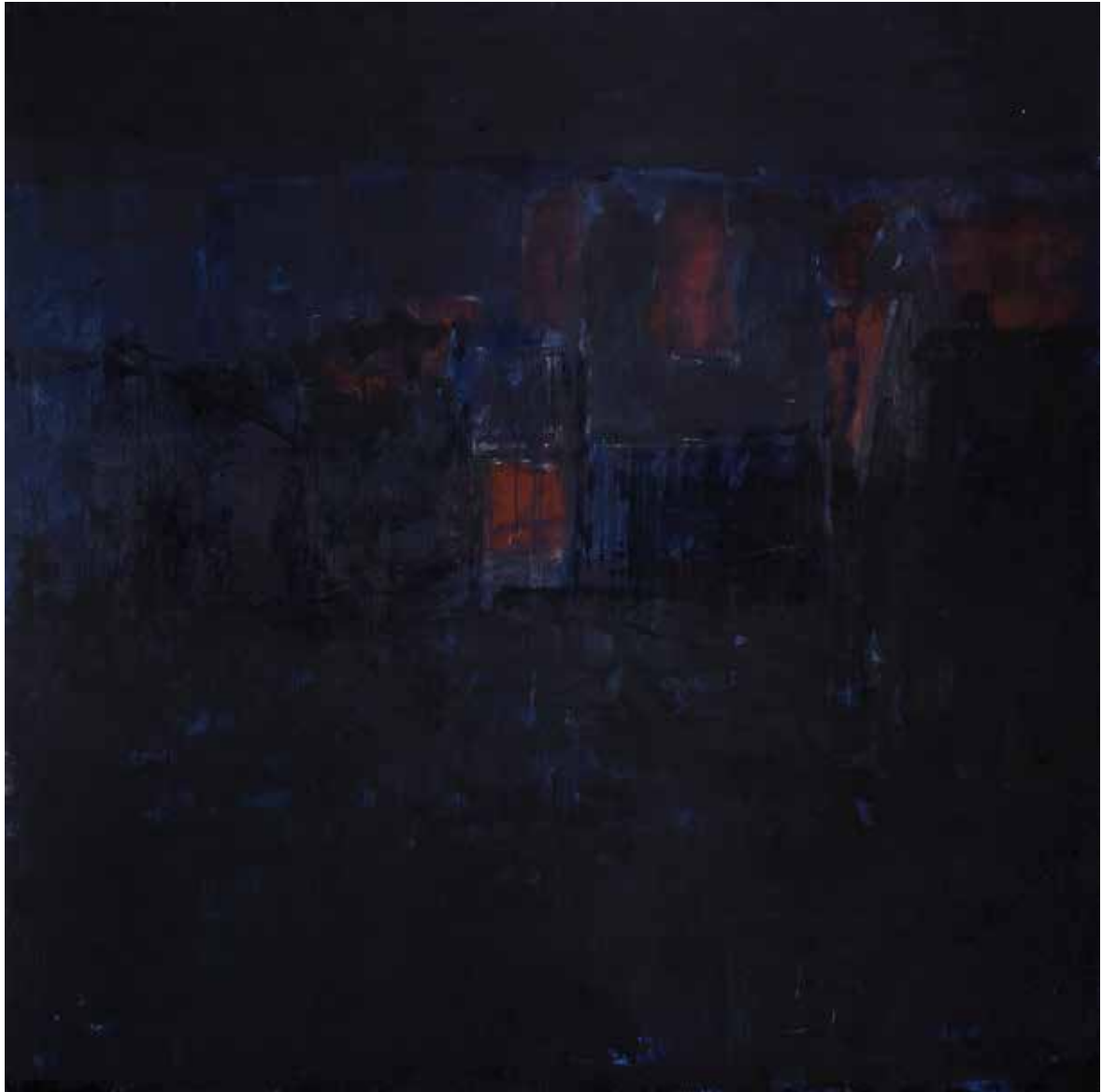
Saâd Hassani, Sans titre , 2022, Technique mixte sur toile, 180 x 180 cm