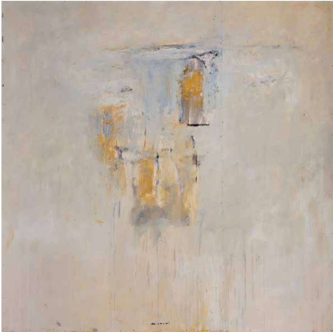
Saâd Hassani, Sans titre , 2022, Technique mixte sur toile, 180 x180 cm