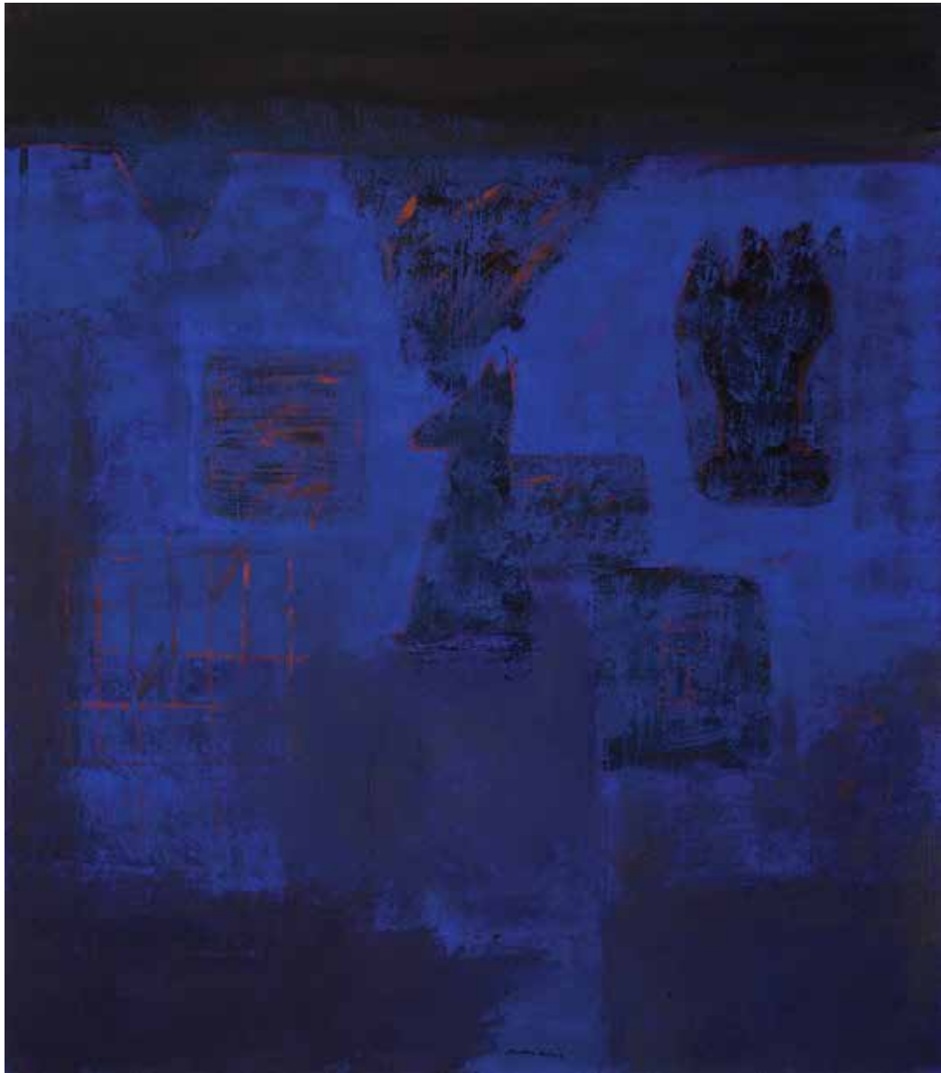
Saâd Hassani, Échiquier , 2022, Technique mixte sur toile, 160 x 140 cm