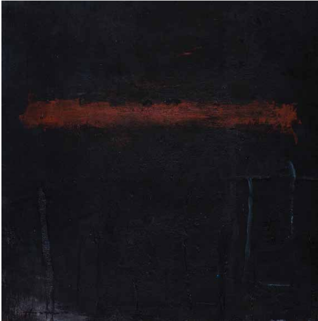
Saâd Hassani, Sans titre , 2022, Technique mixte sur toile, 50 x 50 cm