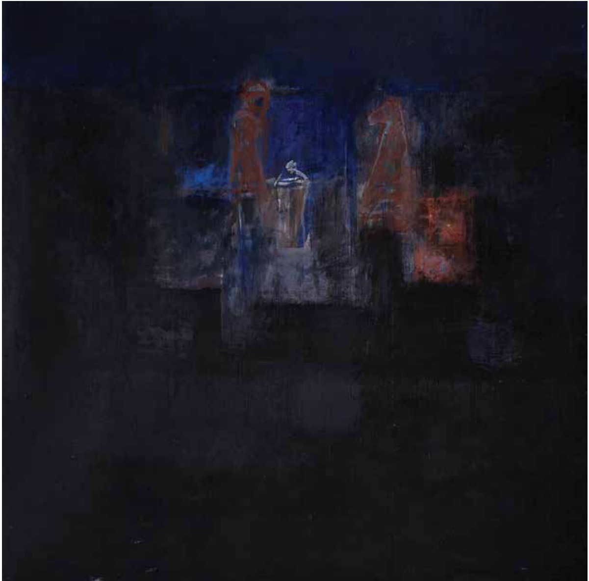
Saâd Hassani, Échiquier , 2022, Technique mixte sur toile, 180 x 180 cm