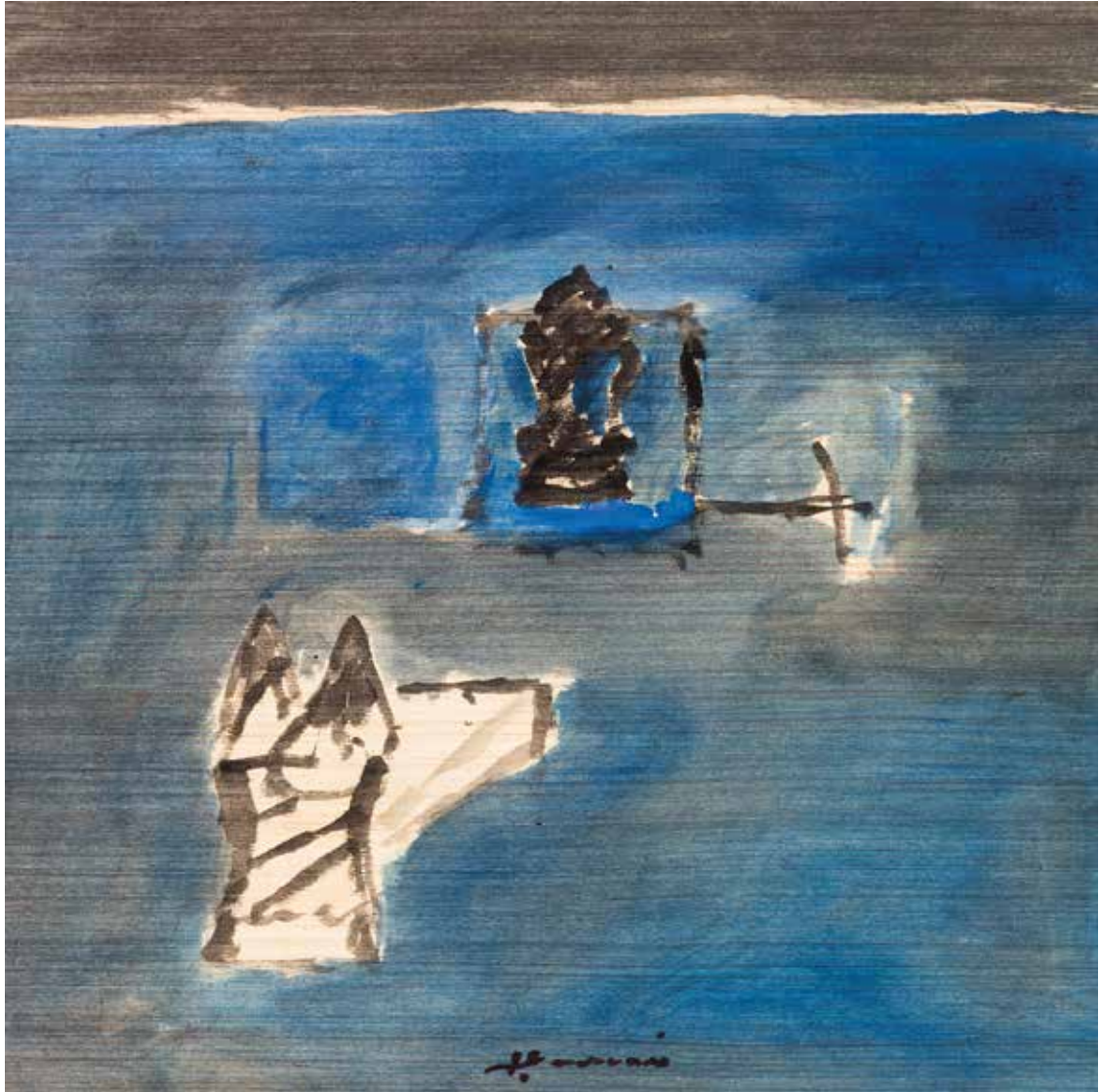
Saâd Hassani, Échiquier , 2022, Technique mixte sur toile, 50 x 50 cm