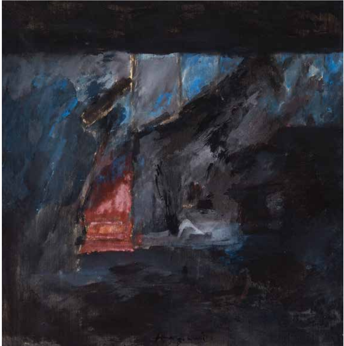
Saâd Hassani, Échiquier , 2022, Technique mixte sur toile, 50 x 50 cm