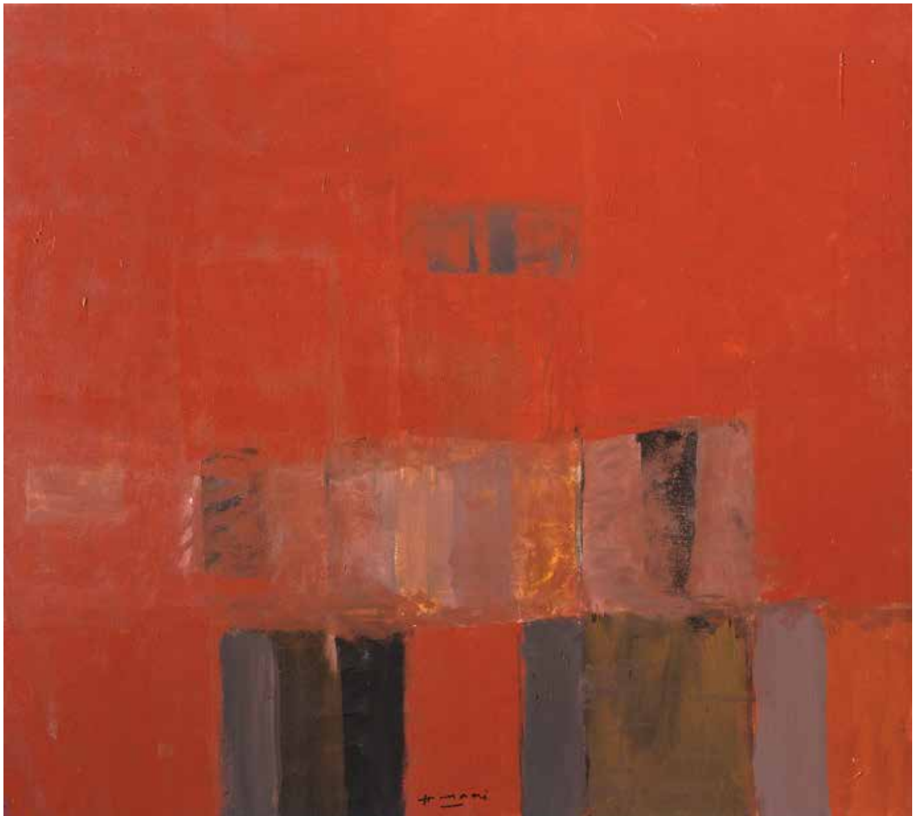
Saâd Hassani, Sans titre , 2022, Technique mixte sur toile, 140 x 160 cm