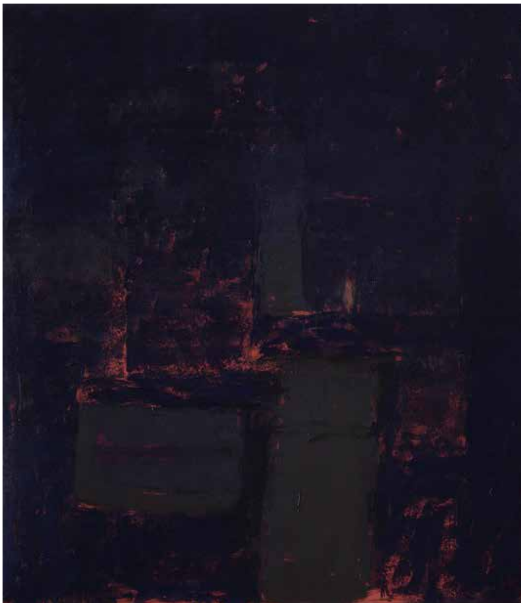
Saâd Hassani, Sans titre , 2022, Technique mixte sur toile, 160 x 140 cm