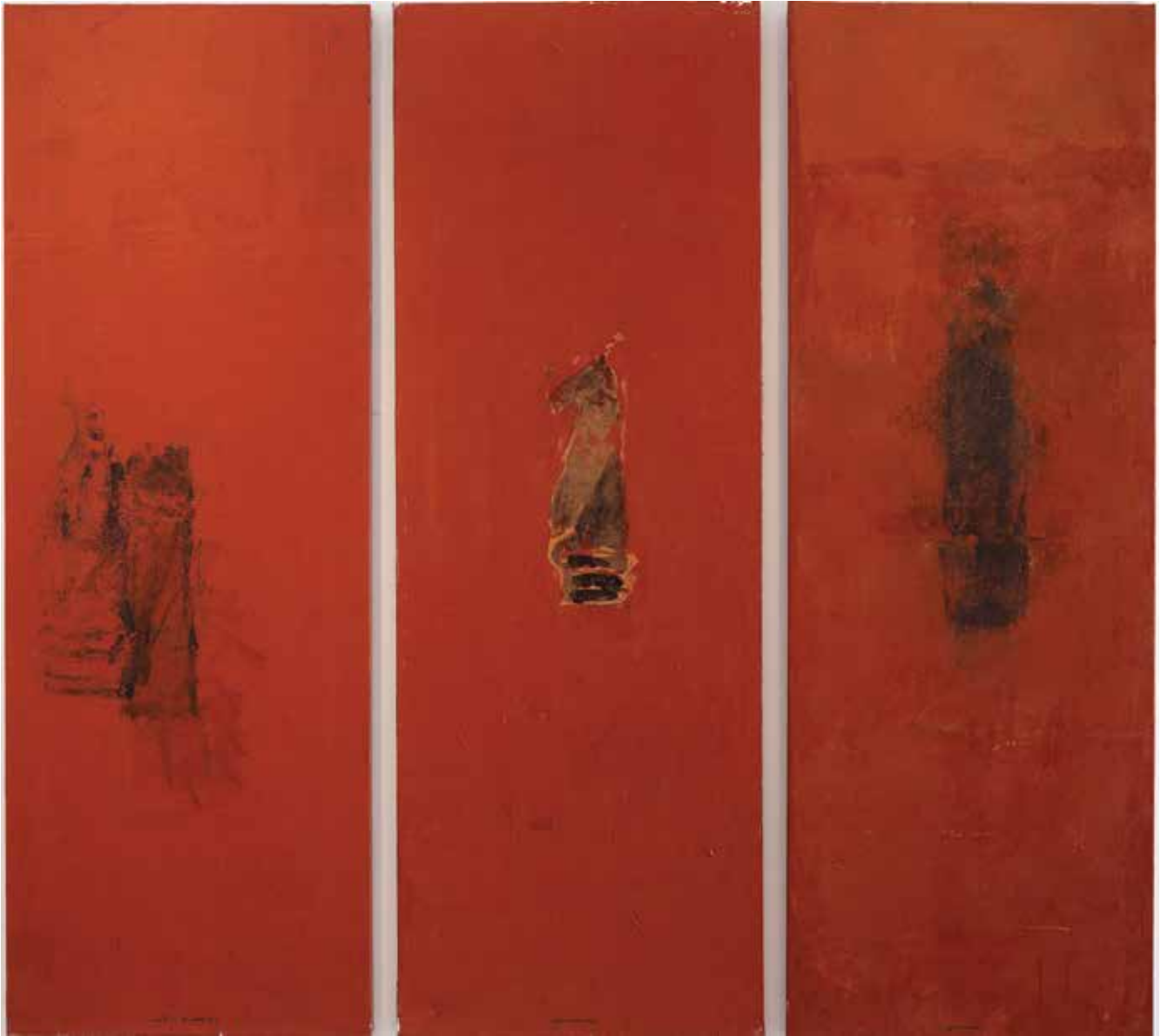
Saâd Hassani, Échiquier , 2021, Technique mixte sur toile, 3 x 180 x 70 cm