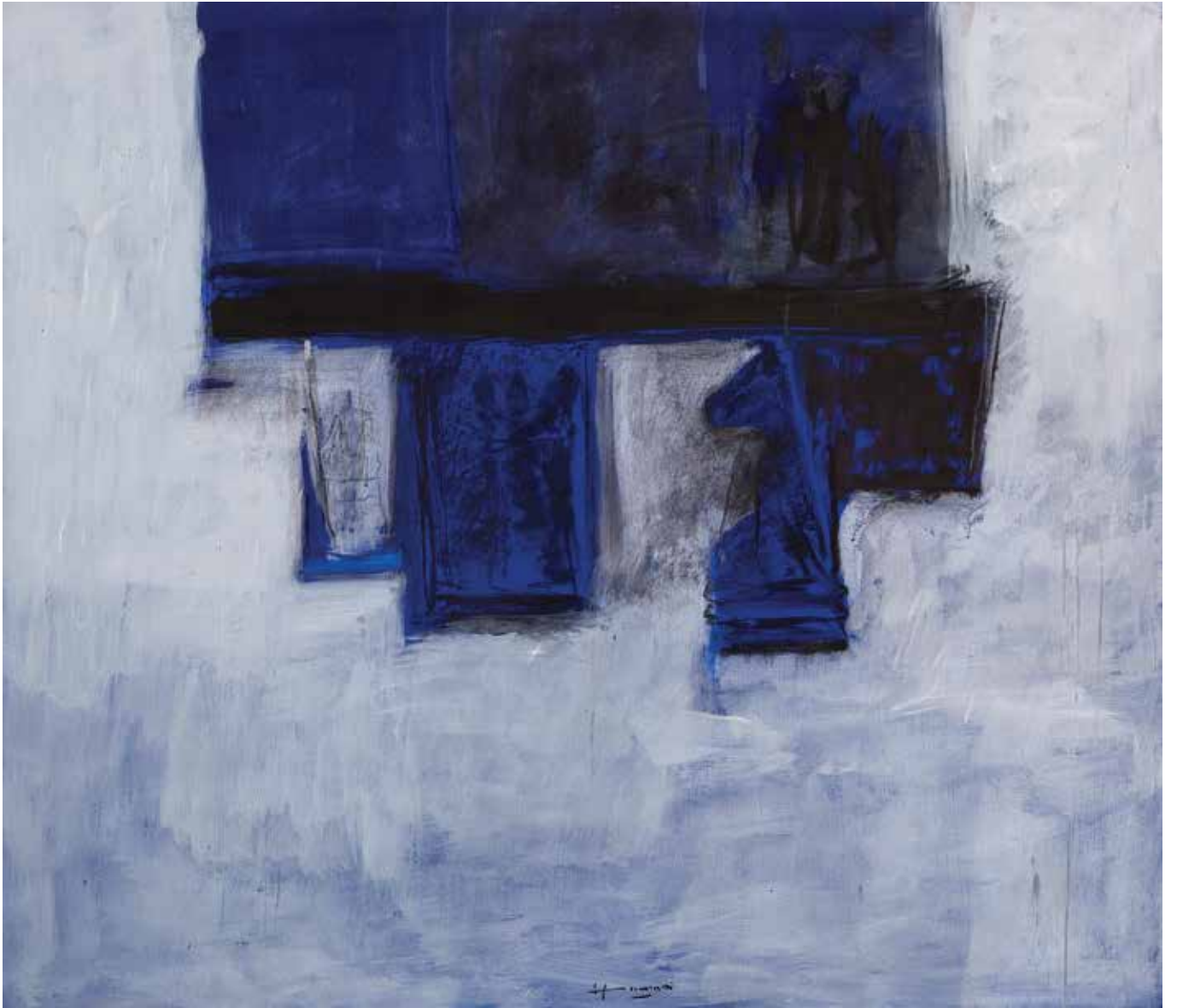
Saâd Hassani, Échiquier , 2022, Technique mixte sur toile, 140 x 160 cm