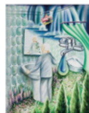
Katarzyna Wyszowska Personal Choices, 2021 Oil on canvas 80 x 60 cm | 31 1/2 x 23 5/8 in (WYSK0010)