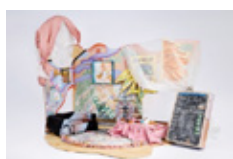
Katarzyna Wyszowska One More Nap, 2022 Own technique 75 x 90 x 65 cm | 29 1/2 x 35 3/8 x 25 5/8 in (WYSK0012)