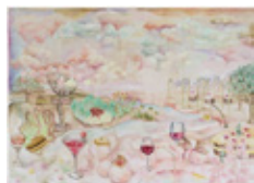
Katarzyna Wyszowska Kraina pieczonych gołąbków, 2022 Oil on canvas 60 x 90 cm | 23 5/8 x 35 3/8 in (WYSK0002)