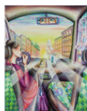
Katarzyna Wyszowska Untitled, 2021 Oil on canvas 80 x 60 cm | 31 1/2 x 23 5/8 in (WYSK0001)