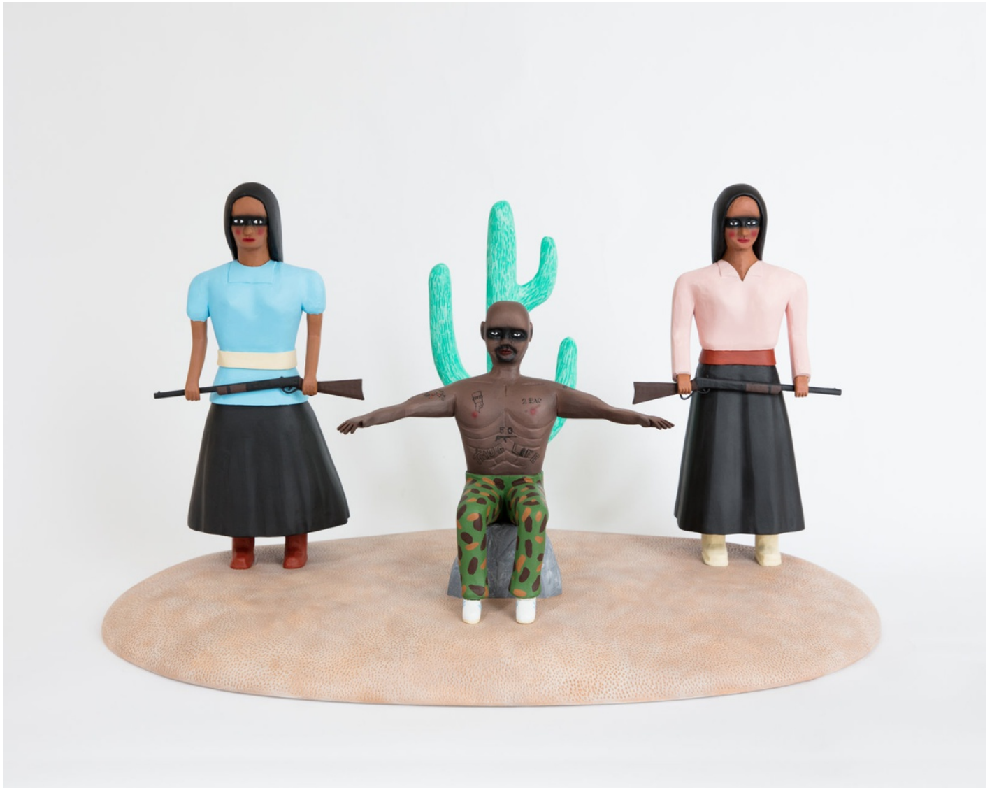
Bemålat trä / Painted wood 43x73x40 cm (RJ2035)