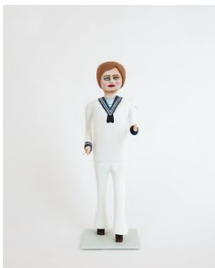
Richard Johansson Permissionen / The Furlough , 2020 Bemålat trä / Painted wood 48x19x14 cm (RJ2027)