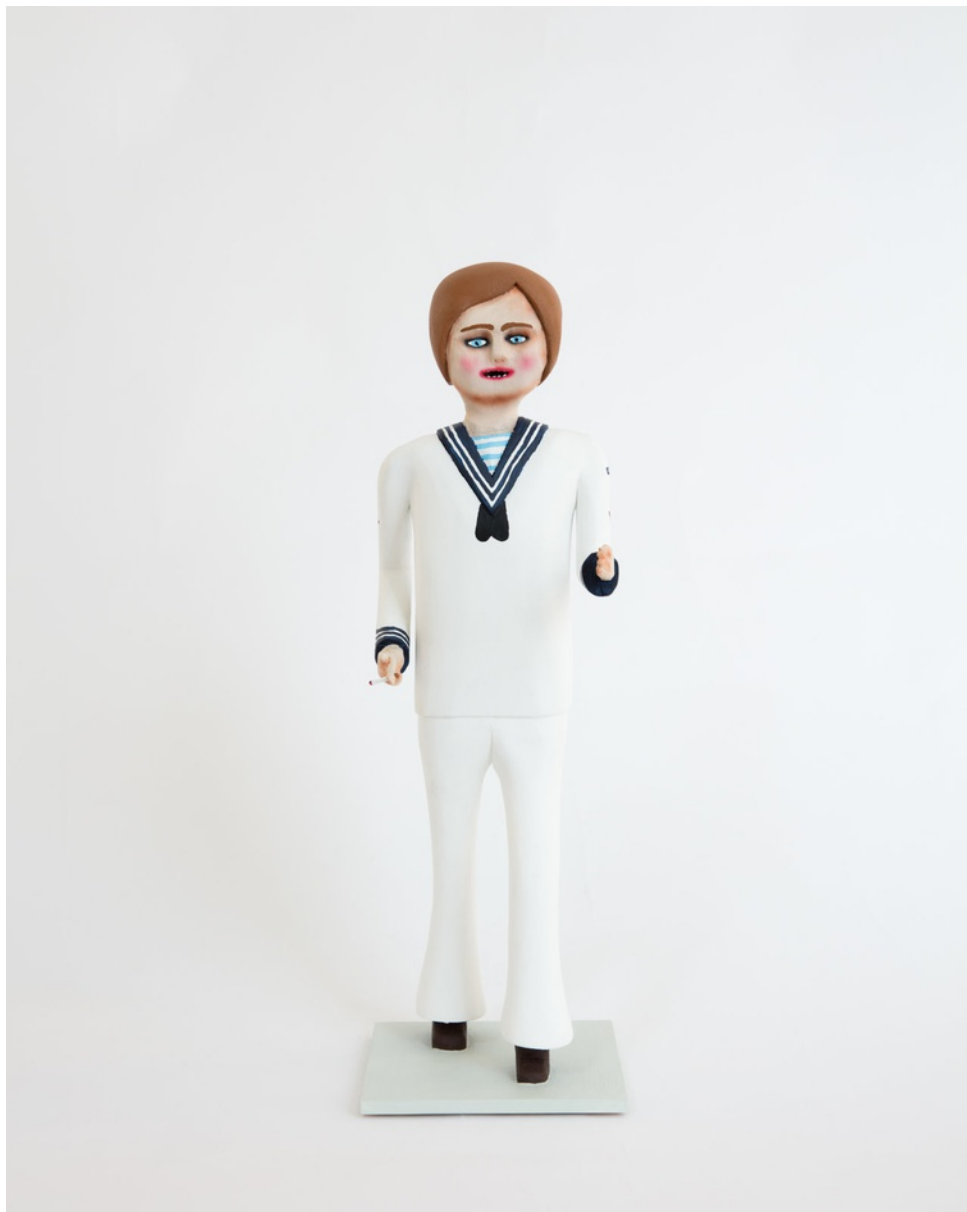
Bemålat trä / Painted wood 48x19x14 cm (RJ2027)

RICHARD JOHANSSON Permissionen / The Furlough, 2020