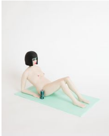
Richard Johansson Summertime Sadness , 2020 Bemålat trä / Painted wood 21x36x19 cm (RJ2033)