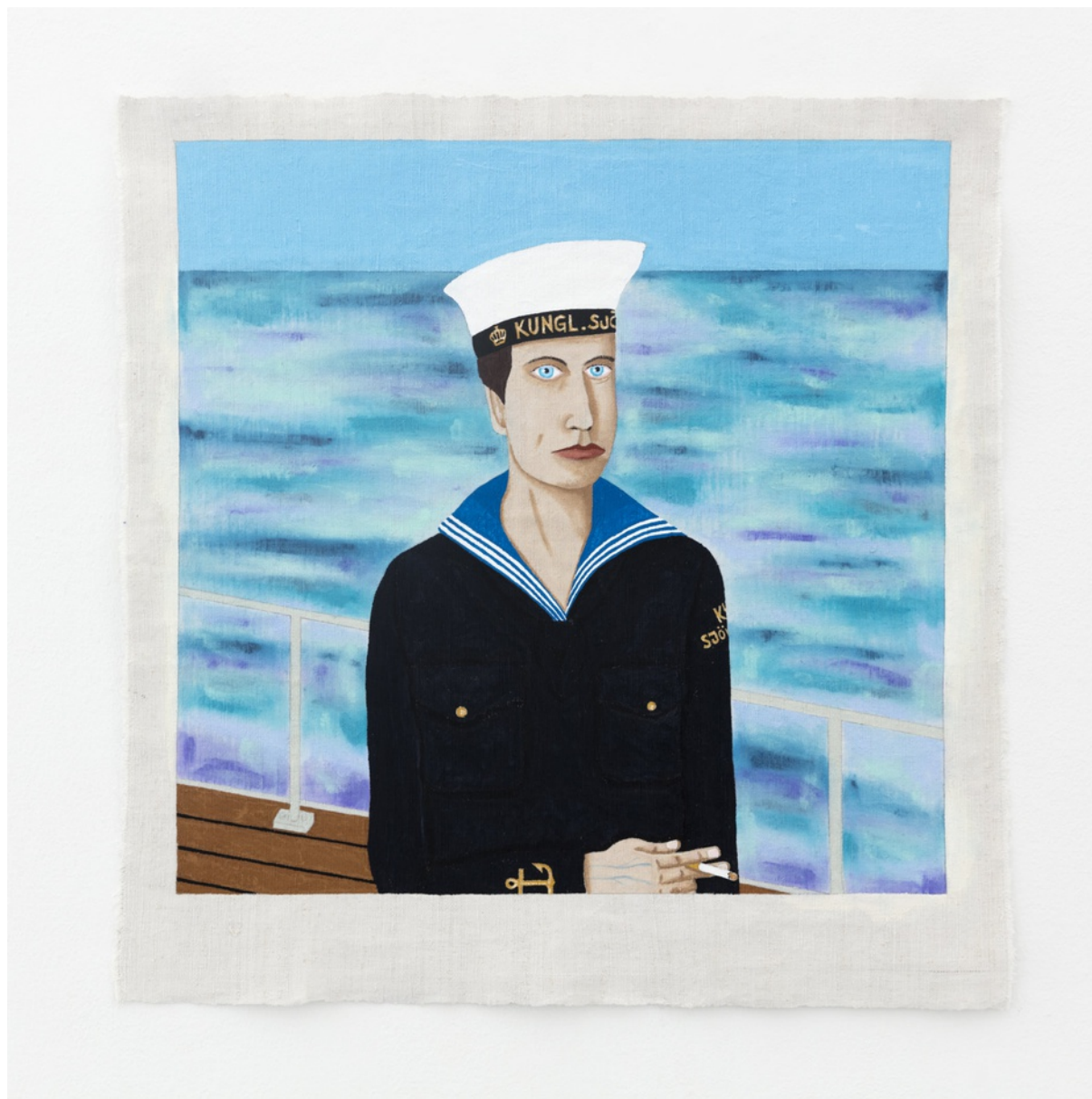
Vynylfärg på linneväv / Vinyl paint on linen 70,5x68 cm (RJ2005)