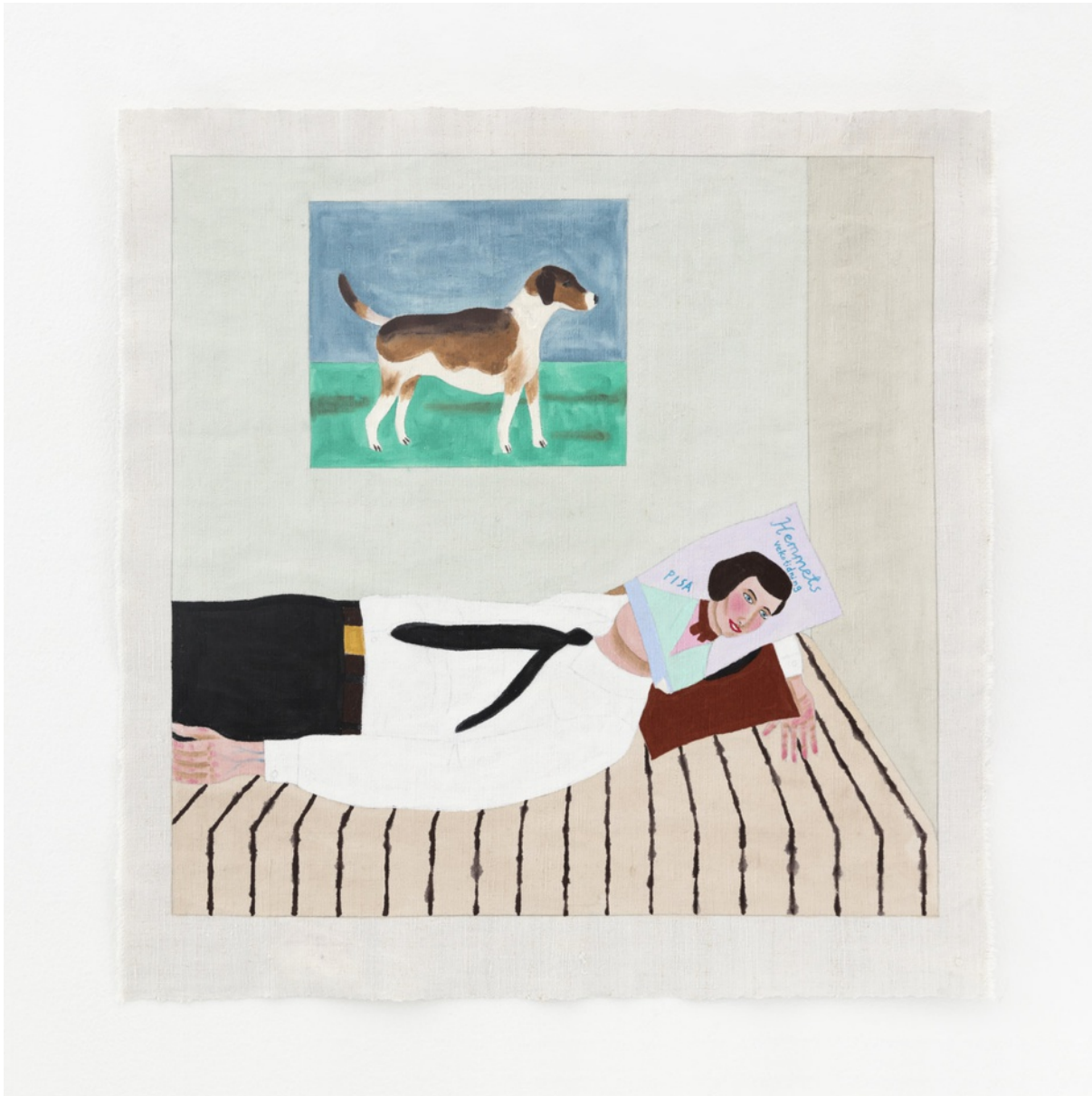
Vynylfärg på linneväv / Vinyl paint on linen 70,5x68 cm (RJ2001)