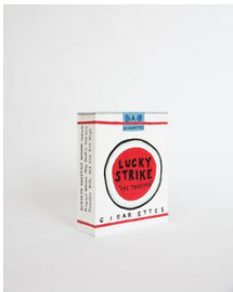
Richard Johansson I Miss You Lucky , 2020 Bemålat trä / Painted wood 25x20x7 cm (RJ2028)