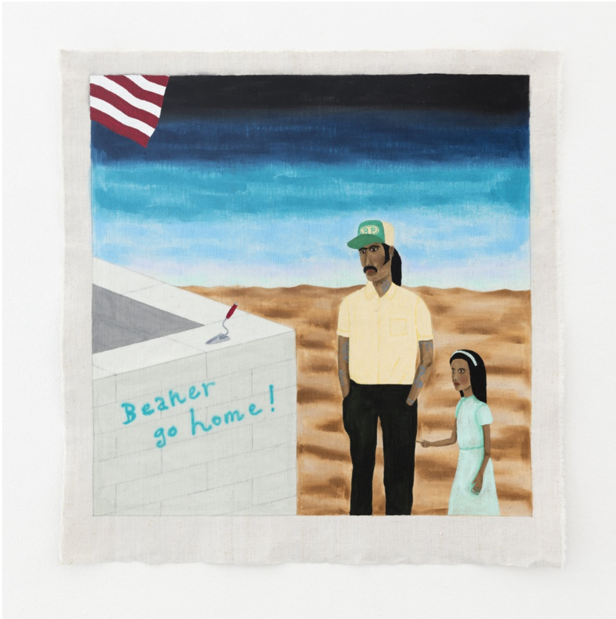
Vynylfärg på linneväv / Vinyl paint on linen 70,5x68 cm (RJ2009)