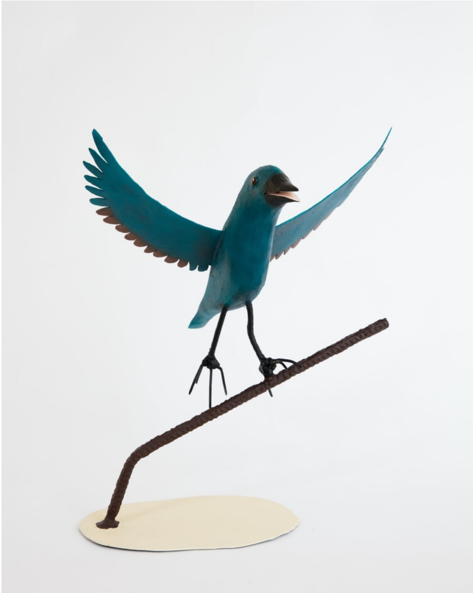
Bemålat trä / Painted wood 35x41x30 cm (RJ2030)

RICHARD JOHANSSON Rödvingad glansstare / Red-winged Starling, 2020