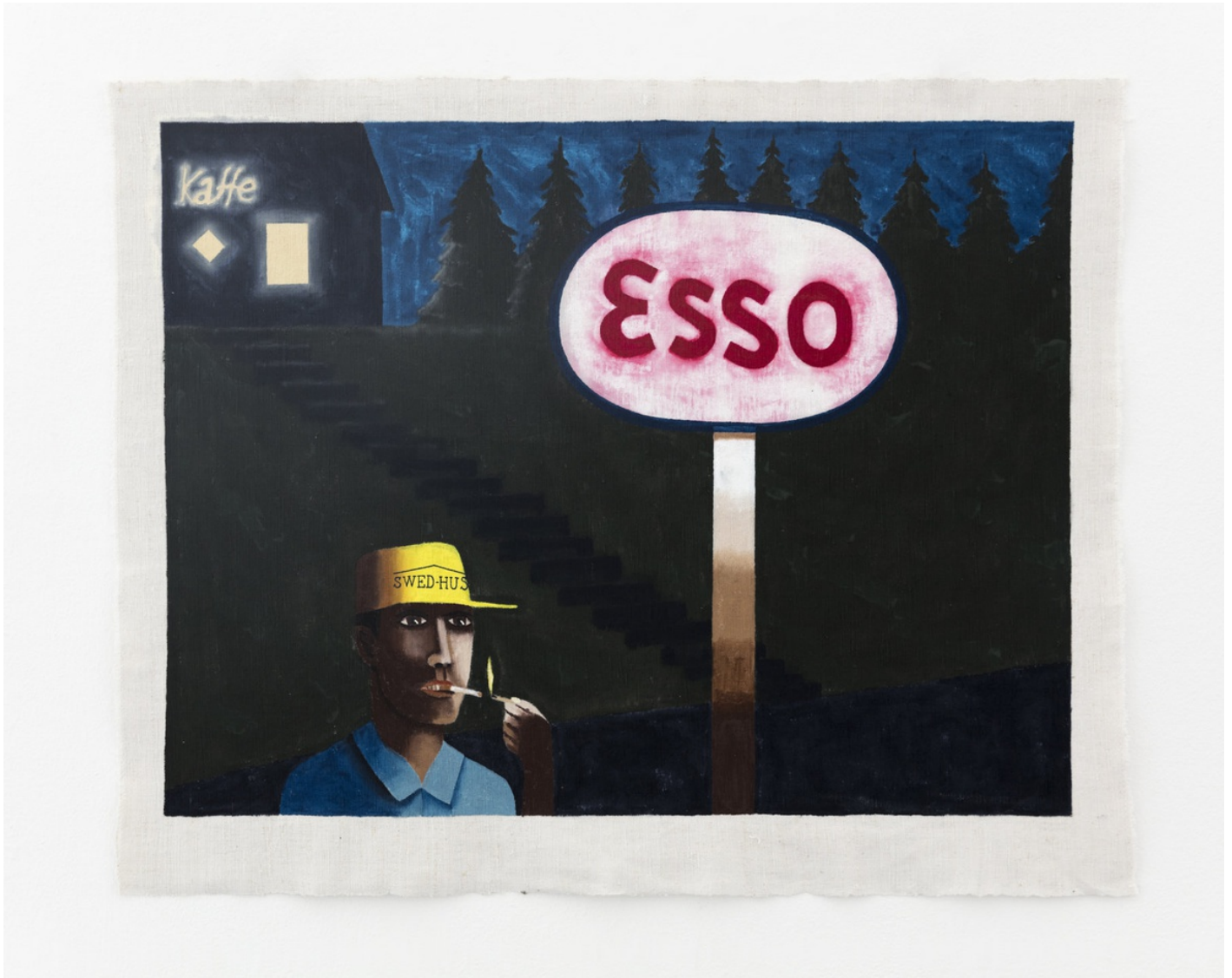
Vinylfärg på linneväv / Vinyl paint on linen 70,5x87 cm (RJ2021)