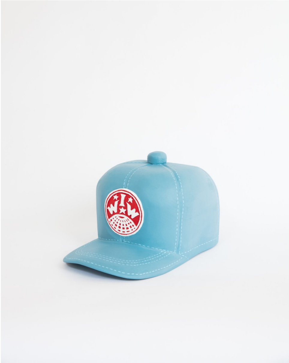
Bemålat trä / Painted wood 37x22x20 cm (RJ2029)