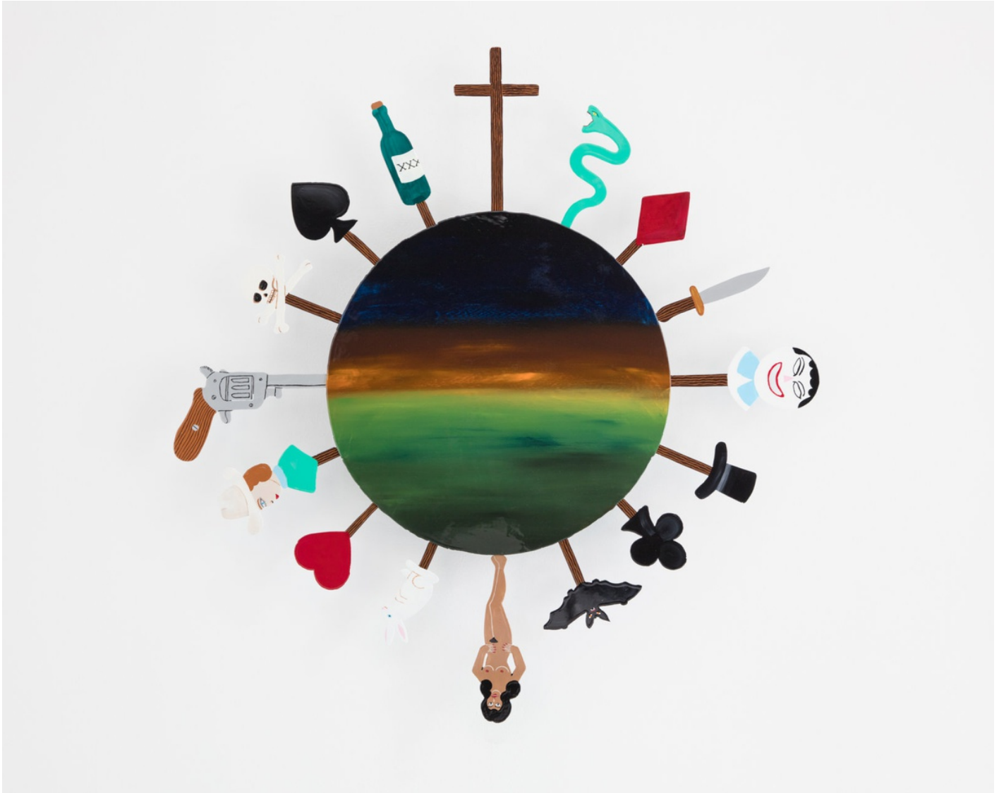
Bemålad metall, lackad / Painted metal, varnish 93x90x6 cm (RJ2037)

RICHARD JOHANSSON Livets lotteri / The Lottery of Life, 2020