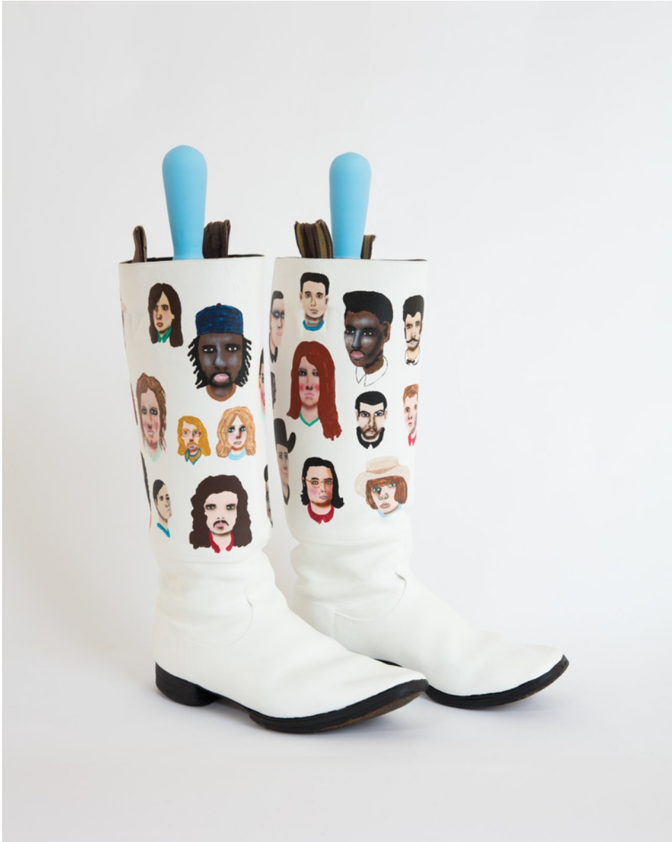
Vynylfärg på stövlar / Vinyl paint on boots 52x29x10 cm vardera / each (RJ2022)

RICHARD JOHANSSON The Twenty-Seven, 2020