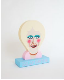
Richard Johansson Sweet Dolly , 2020 Bemålat trä / Painted wood 41x30x13 cm (RJ2025)