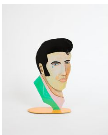
Richard Johansson Kingen , 2020 Bemålat metall / Painted metal 20x11x33 cm (RJ2031)