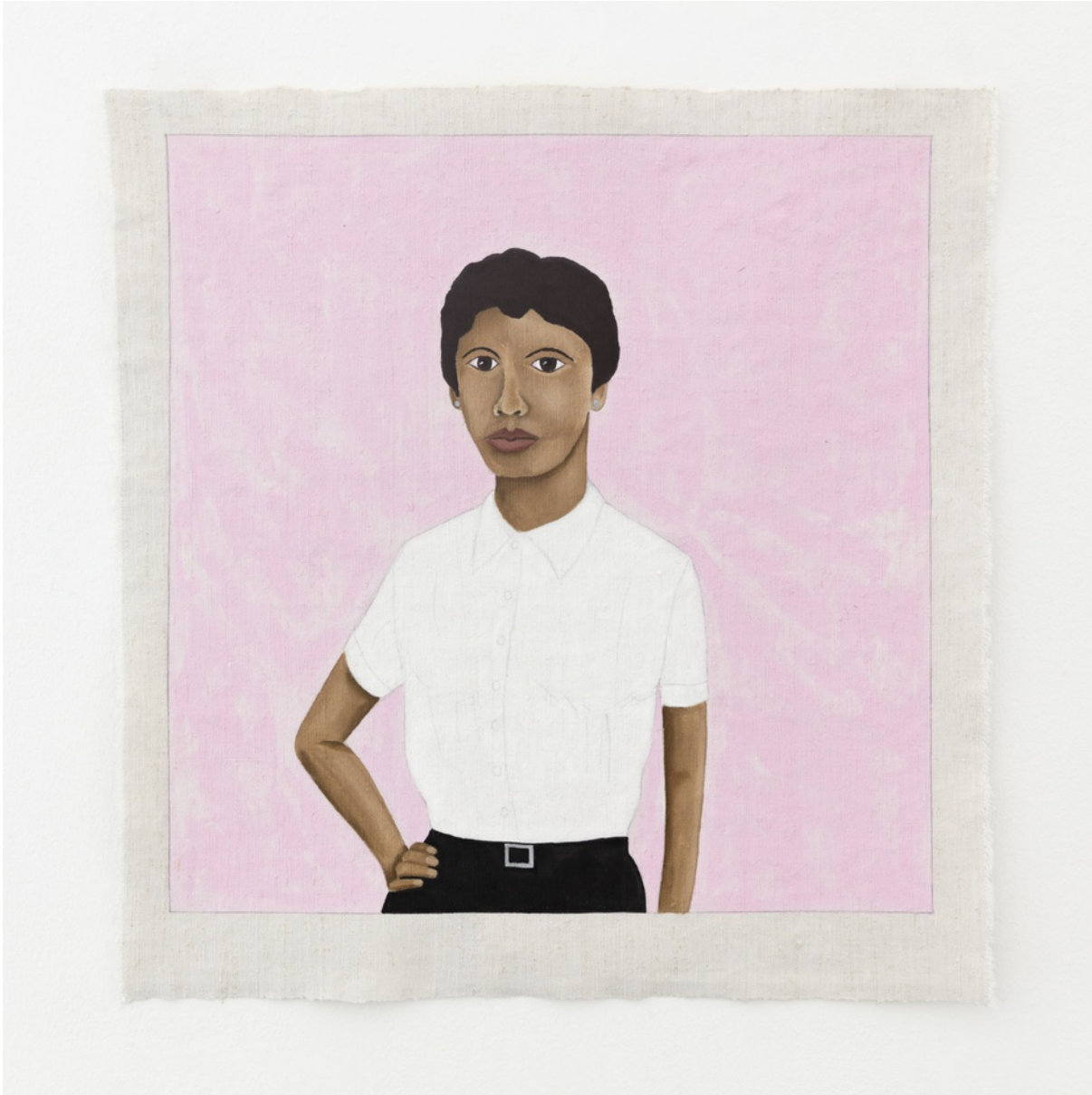
Vynylfärg på linneväv / Vinyl paint on linen 70,5x68 cm (RJ2008)