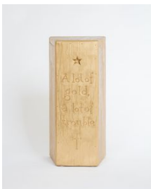
Richard Johansson A Lot of Gold , 2020 Vynylfärg på trä / Vinyl paint on carved wood 46x22x14 cm (RJ2026)