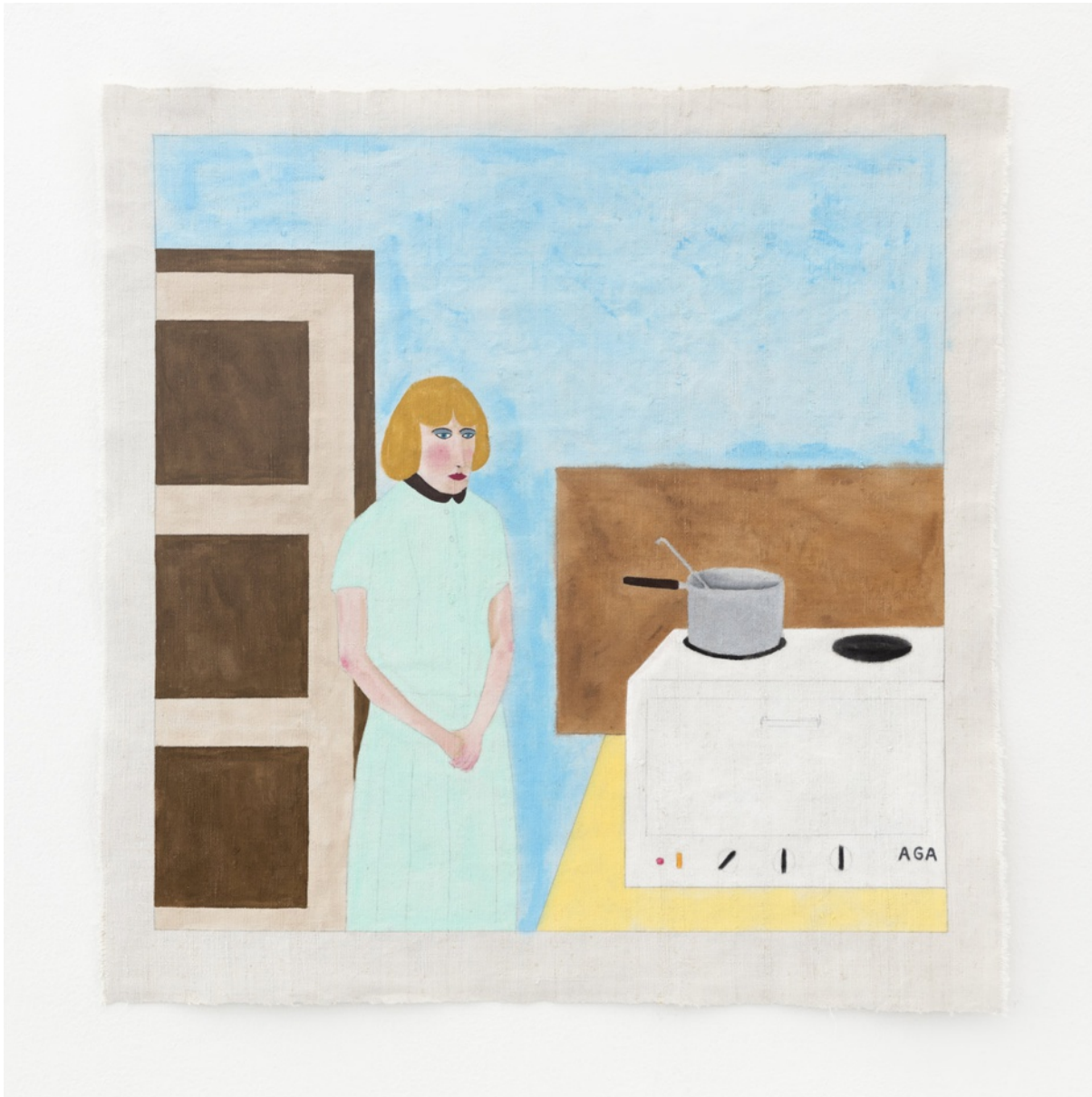
Vynylfärg på linneväv / Vinyl paint on linen 70,5x68 cm (RJ2002)