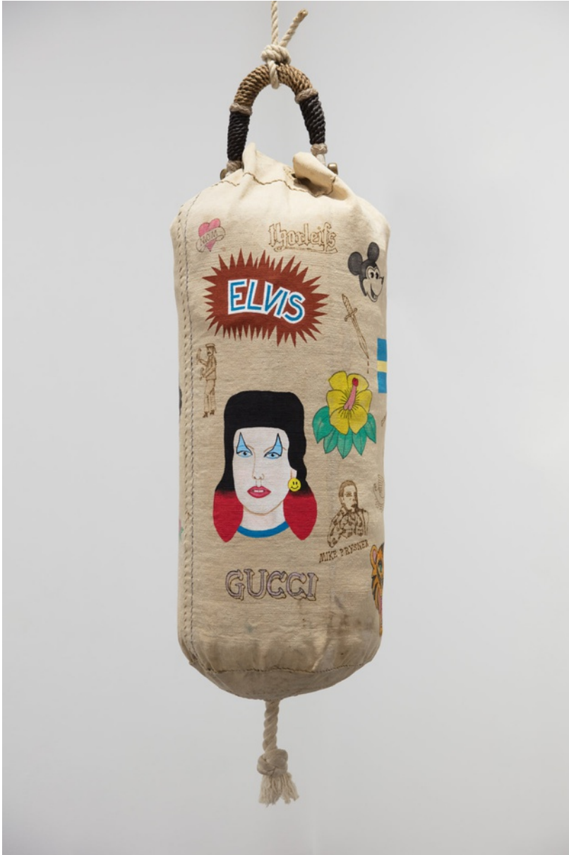
Bemålat och glödtecknat objekt / Vinyl paint and soldering on object 140x35x35 cm (RJ2023)

RICHARD JOHANSSON Tears in My Beer , 2020