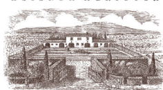
Foto dell'azienda agricola Casale del Giglio, alla Ferrarese