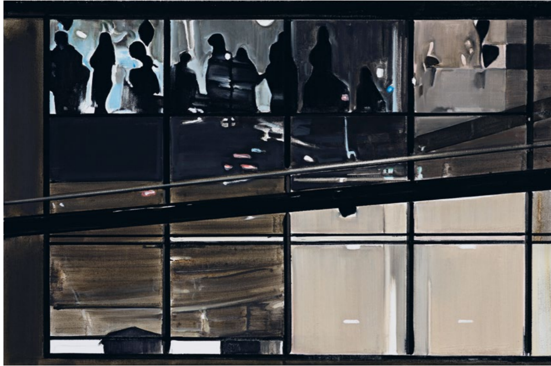
Previous page Light Grid , 2021 Oil and acrylic on canvas 200 x 150 cm