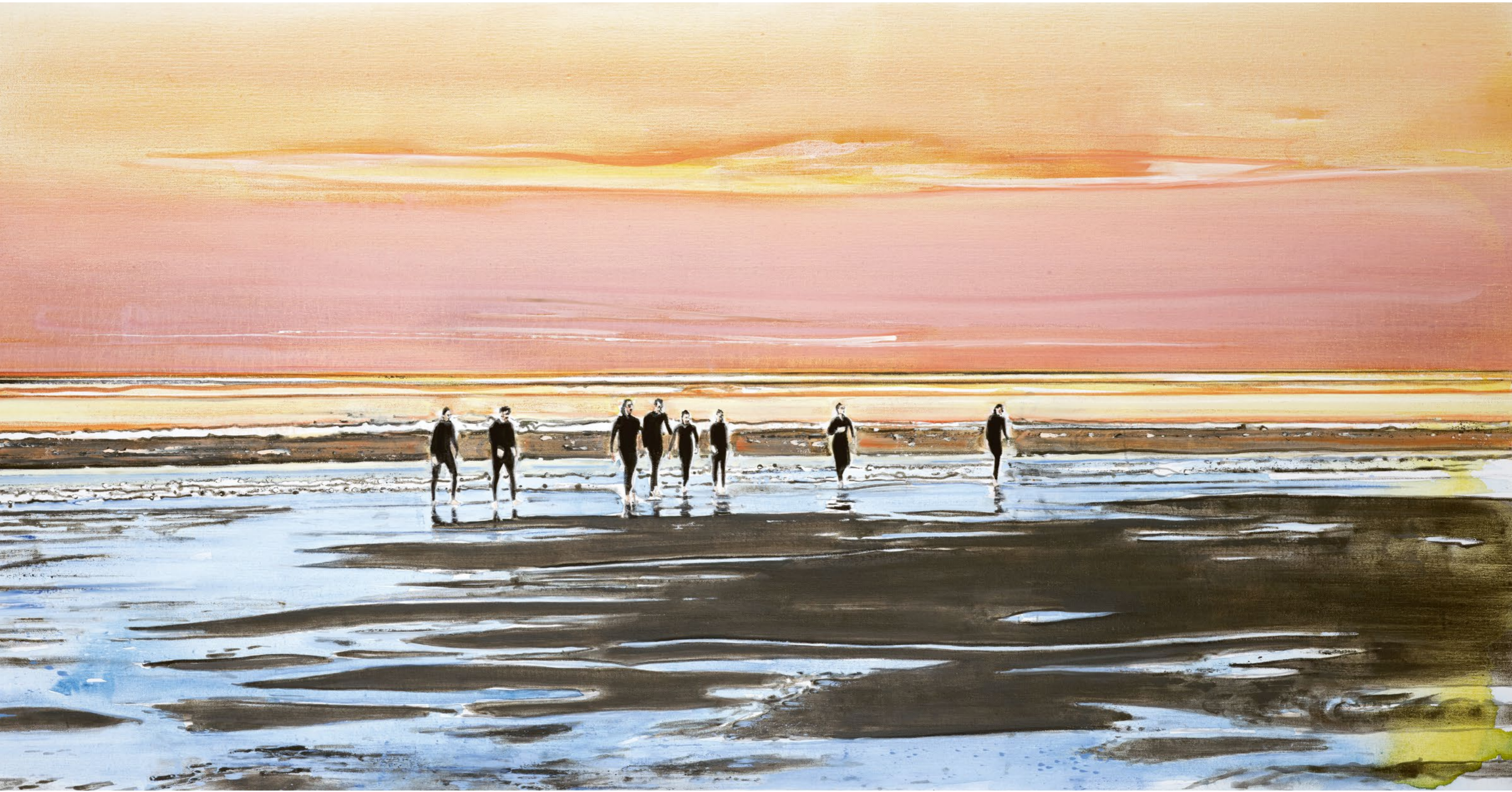
Endure , 2023 Oil and acrylic on canvas 100 x 200 cm