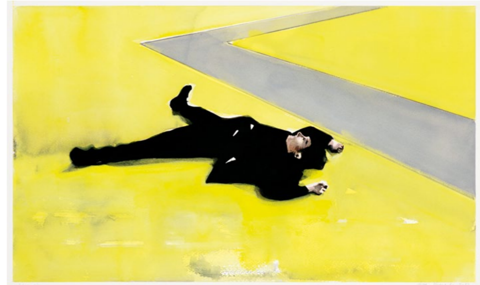
Ground, 2023 Gouache on paper 43.4 x 71.2 cm