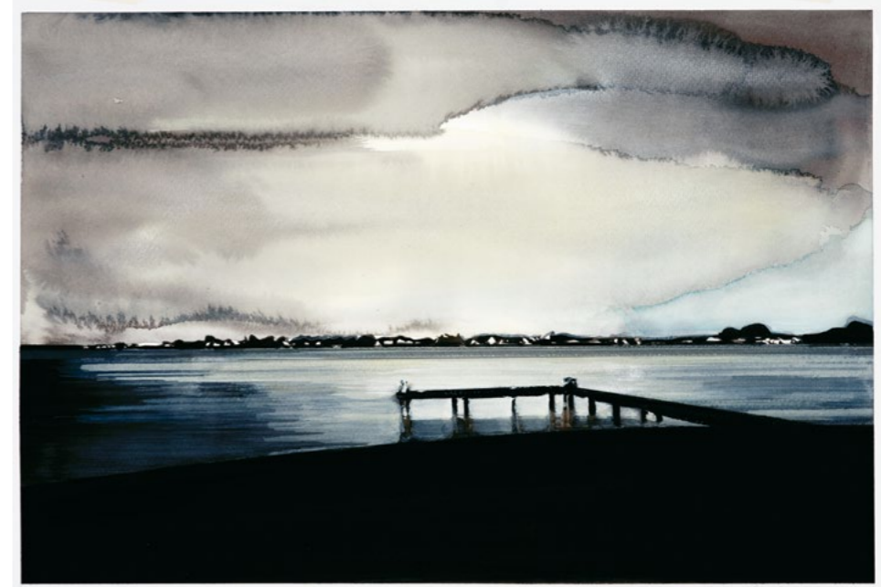
Move, 2023 Gouache on paper 42.4 x 62.1 cm