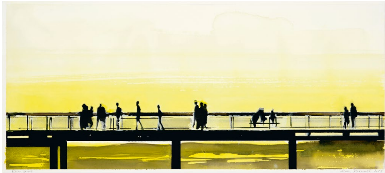
Yellow Bridge , 2023 Gouache on paper 36.5 x 81.5 cm