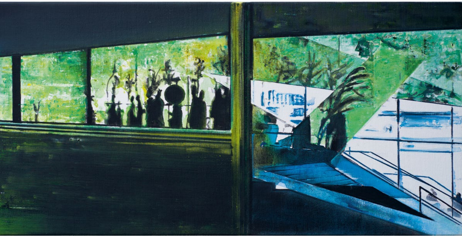
Parade, 2023 Oil and acrylic on canvas 50 x 100 cm