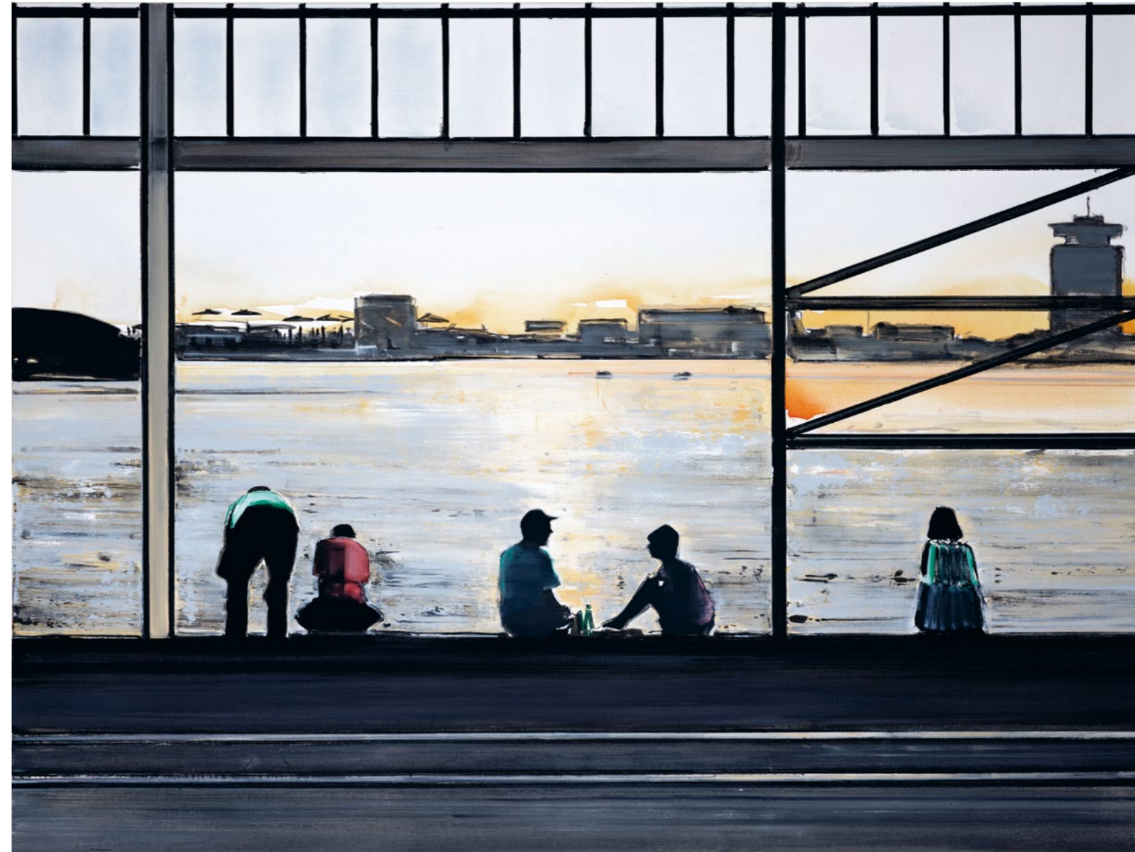
Soul Shade , 2023 Gouache on paper 35 x 49.4 cm