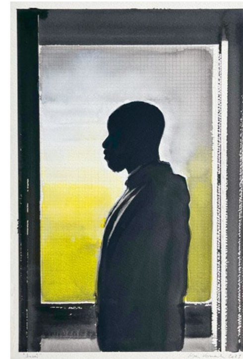
Sensei , 2023 Gouache on paper 45 x 30.3 cm