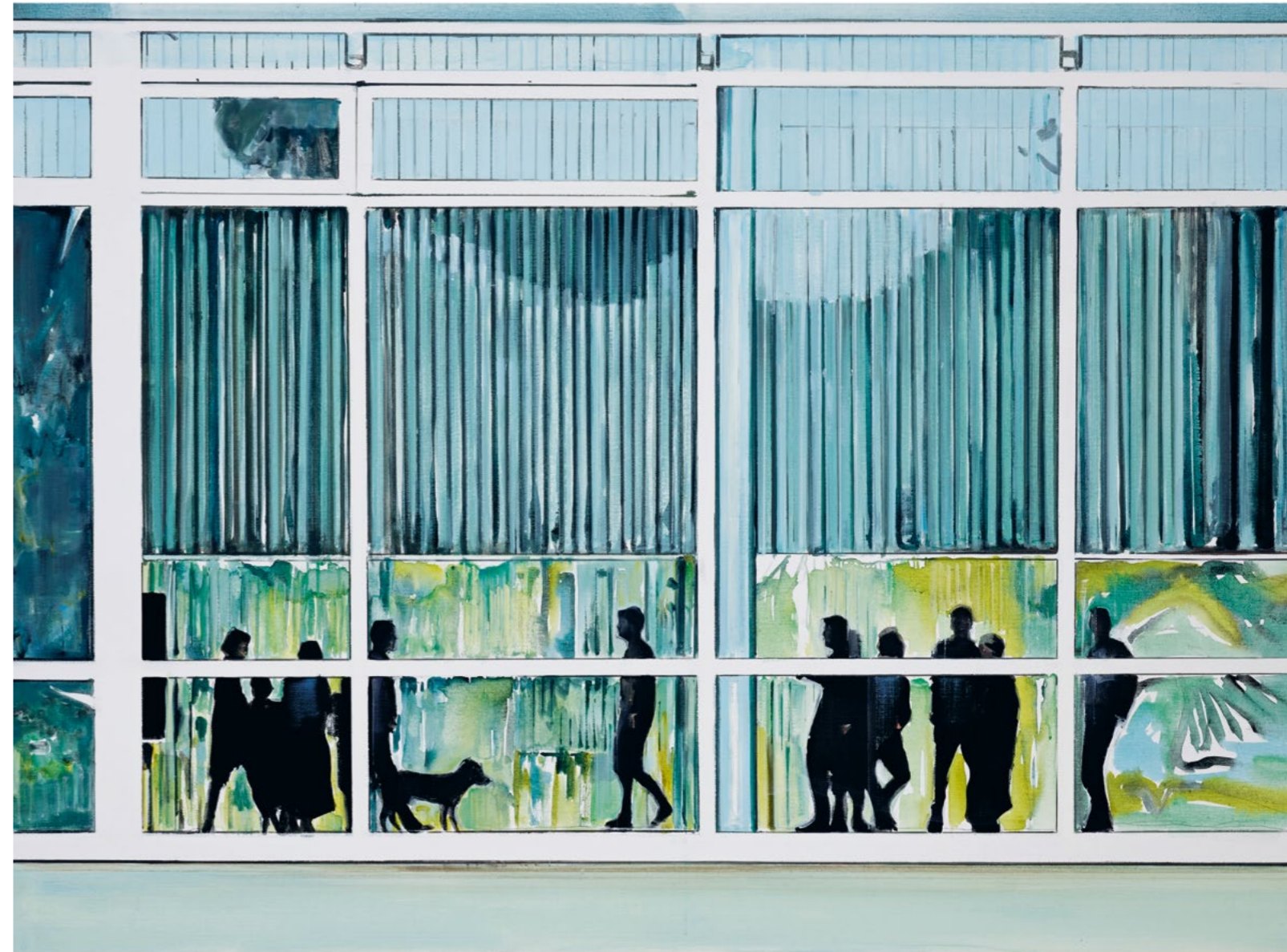
Glass House , 2023 Oil and acrylic on canvas 110 x 150 cm